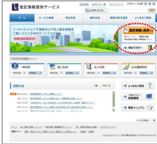
(「トップページ」画面)